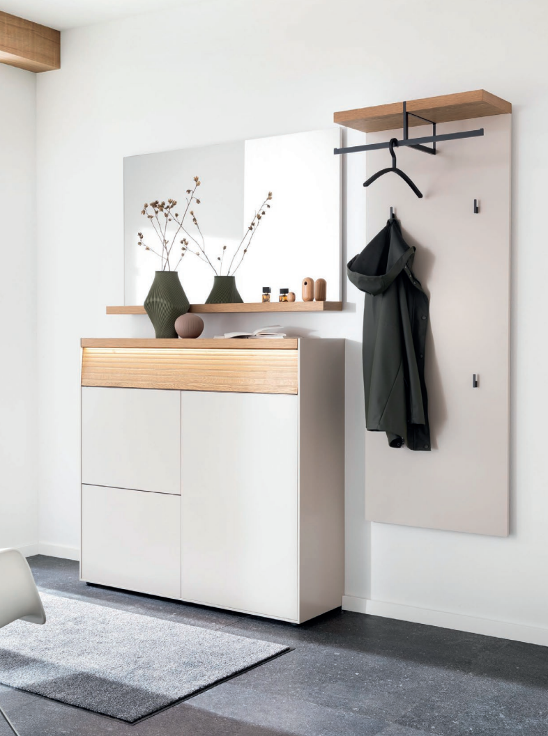
► LUIS 4 | B 192 x H 202 x T 35 cm, Lack kaschmir, Eiche canyon