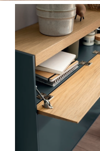
LUIS 6 | W 150 x H 198 x D 20 cm, blue-green lacquer, wild oak