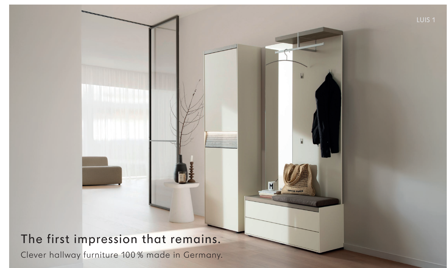
The first impression that remains. Clever hallway furniture 100% made in Germany.

Raffinierte Garderoben 100% Made in Germany.