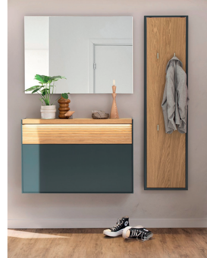
▲ LUIS 6 | B 150 x H 198 x T 20 cm, Lack blaugrün, Wildeiche

Whether in the hallway, bedroom or guest room – the panel creates stylish organisation exactly where it's needed. Available with hooks or mirror, it offers a well-designed solution for temporary storage and flexible everyday use.