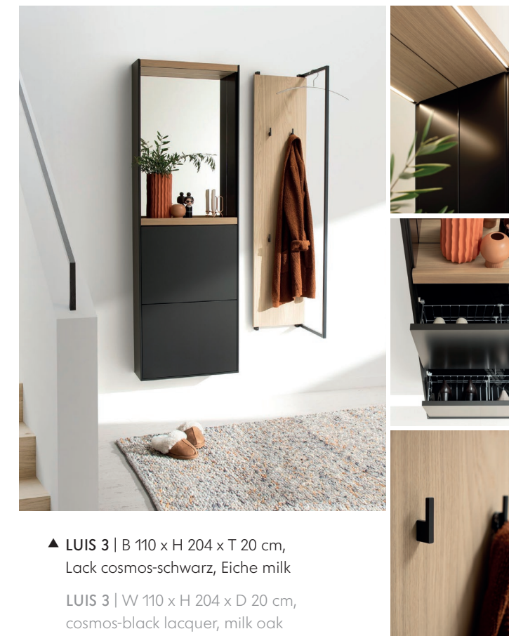
LUIS 3 | W 110 x H 204 x D 20 cm, cosmos-black lacquer, milk oak