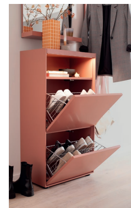
► LUIS 2 | B 120 x H 202 x T 35 cm, Lack samtbeere