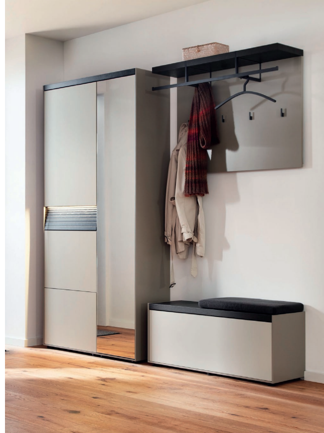
◀ LUIS 5 | B 210 x H 203,8 x T 35 cm, Lack terra, Lack kaschmir, Eiche anthrazit

With clean lines, high-quality materials and well-designed lighting, LUIS brings style and order to the entrance area. The striking top panel and finely crafted front, framed by a narrow, delicate carcass line, create an elegant overall look. Practical extras such as the illuminated drawers make everyday life easier – and ensure a lasting first impression. The subtle 'sundown' grooved structure adds a stylish touch and lends the front a distinctive depth.