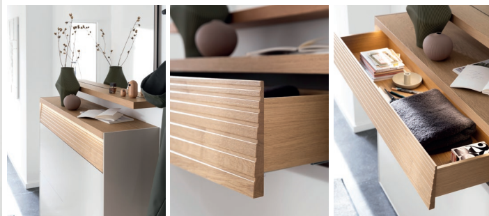
LUIS 4 | W 192 x H 202 x D 35 cm, cashmere lacquer, canyon oak

Mit klaren Linien, hochwertigen Materialien und durchdachter Beleuchtung bringt LUIS Stil und Ordnung in den Eingangsbereich. Das markante Deckblatt und die fein gearbeitete Front, eingefasst von einer schmalen filigranen Korpuslinie, schafft ein elegantes Gesamtbild. Praktische Extras wie die beleuchteten Schubladen machen den Alltag leichter – und den ersten Eindruck unvergesslich. Die feine Rillenstruktur „sundown“ setzt dabei einen stilvollen Akzent und verleiht der Front charaktervolle Tiefe.