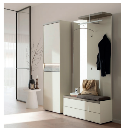
► LUIS 1 | TITEL | B 170 x H 203,8 x T 35 cm, Lack magnolia, Eiche sahara LUIS 1 | TITEL | W 170 x H 203,8 x D 35 cm, magnolia lacquer, sahara oak